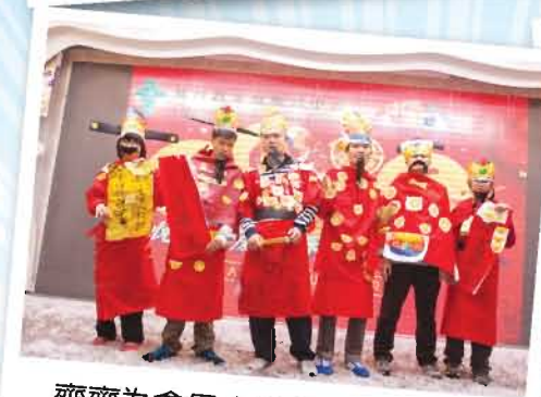
齊齊為會員大變身，邊個財神造型最正呢？！