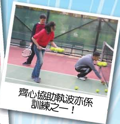
齊心協助執波亦係訓練之一！