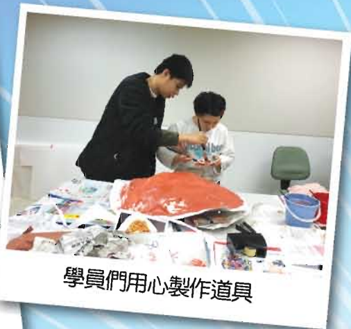
學員們用心製作道具