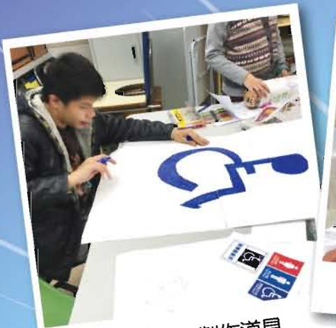
學員們用心製作道具