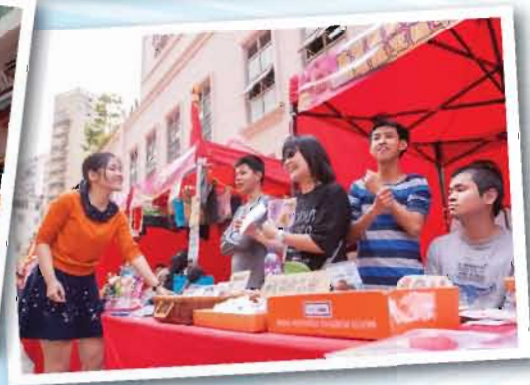
學員齊心向遊人推介由中心會員製作的產品，並一同欣賞舞龍表演。