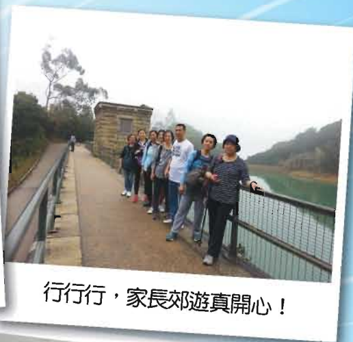
行行行，家長郊遊真開心！