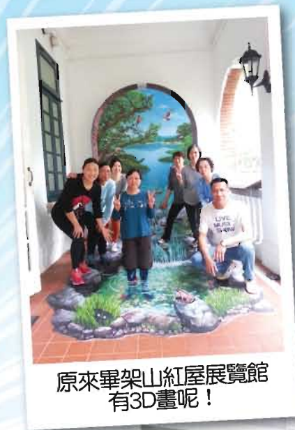
原來畢架山紅屋展覽館 有3D畫呢！