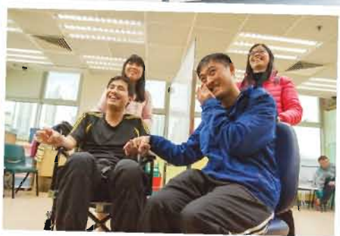
義工與會員排劇時打成一片，笑聲不斷，大家記住留意我地7月3日的大滙演演出啦！