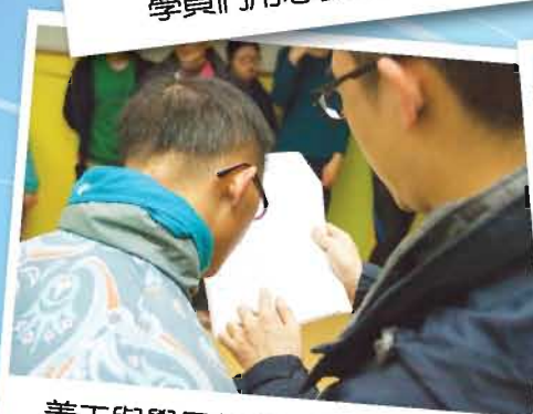
義工與學員都認真地熟讀劇本