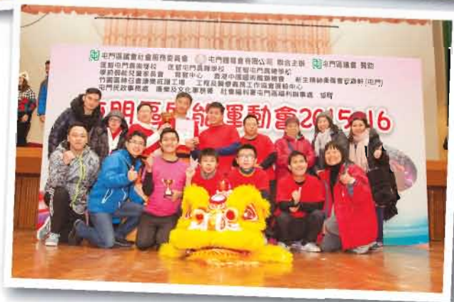
會員們表現出色，勇奪獅藝組金獎、男子拳術組銀獎及舞蹈優異獎，可喜可賀！