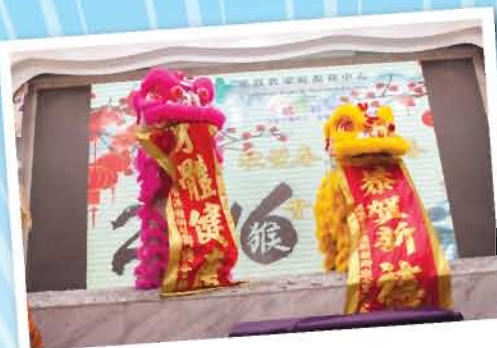
中心的醒獅隊好生猛呀！