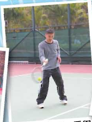
雖然只係第一季學網球，但正手抽擊已經無難度！