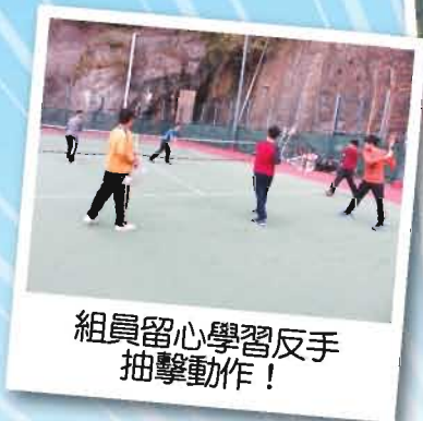
組員留心學習反手抽擊動作！