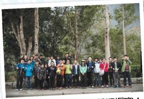
穿山甲行山隊出發勇闖梧桐寨！